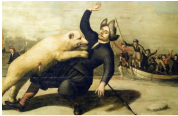
Walvisjagers op Spitsbergen