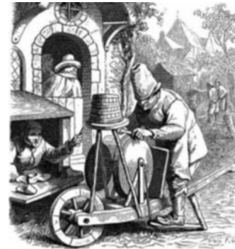
scharenslijper, 17e eeuw Scharenslijper