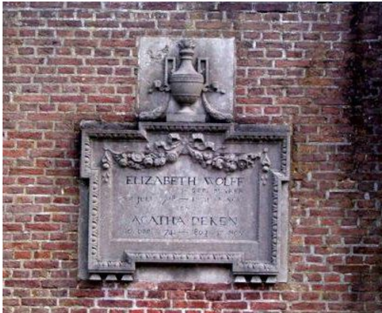
Gedenksteen op begraafplaats Ter navolging te Scheveningen

Ze blijven beiden met hun gezondheid kwakkelen. Dan is de één weer bedlegerig, dan de ander weer en moeten ze elkaar verplegen. Aagje heeft voortdurend last van haar gal en Betje van haar jicht. Dat ze er in die tijd en onder die omstandigheden toch in slagen om samen te werken aan hun boek met als hoofdpersoon een meisje Sara Burgerhart, die een levende kopie van Betje zelf is, is een godswonder.