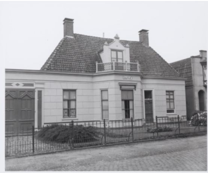
Het Betje Woff-huis in Middenbeemster omstreeks 1951

Betje bleef het moeilijk hebben met het feit, dat Aagje alleen op grond van de roddels, die ze hoorde, meteen haar oordeel klaar bleek te hebben. Zonder haar zelf ooit ontmoet te hebben en haar mening gehoord te hebben. En dat ze nu van Aagje moest aanhoren, dat ze haar leven moest verbeteren! Omgekeerd, voegde ze er aan toe, had Betje nooit één kwaad woord over Aagje gesproken. En wat Betje al helemaal niet zinde was, dat Aagje haar gelijk wilde halen door haar te adviseren zich tot God te wenden, zodat ze zogenaamd weer op het rechte pad gebracht zou worden.